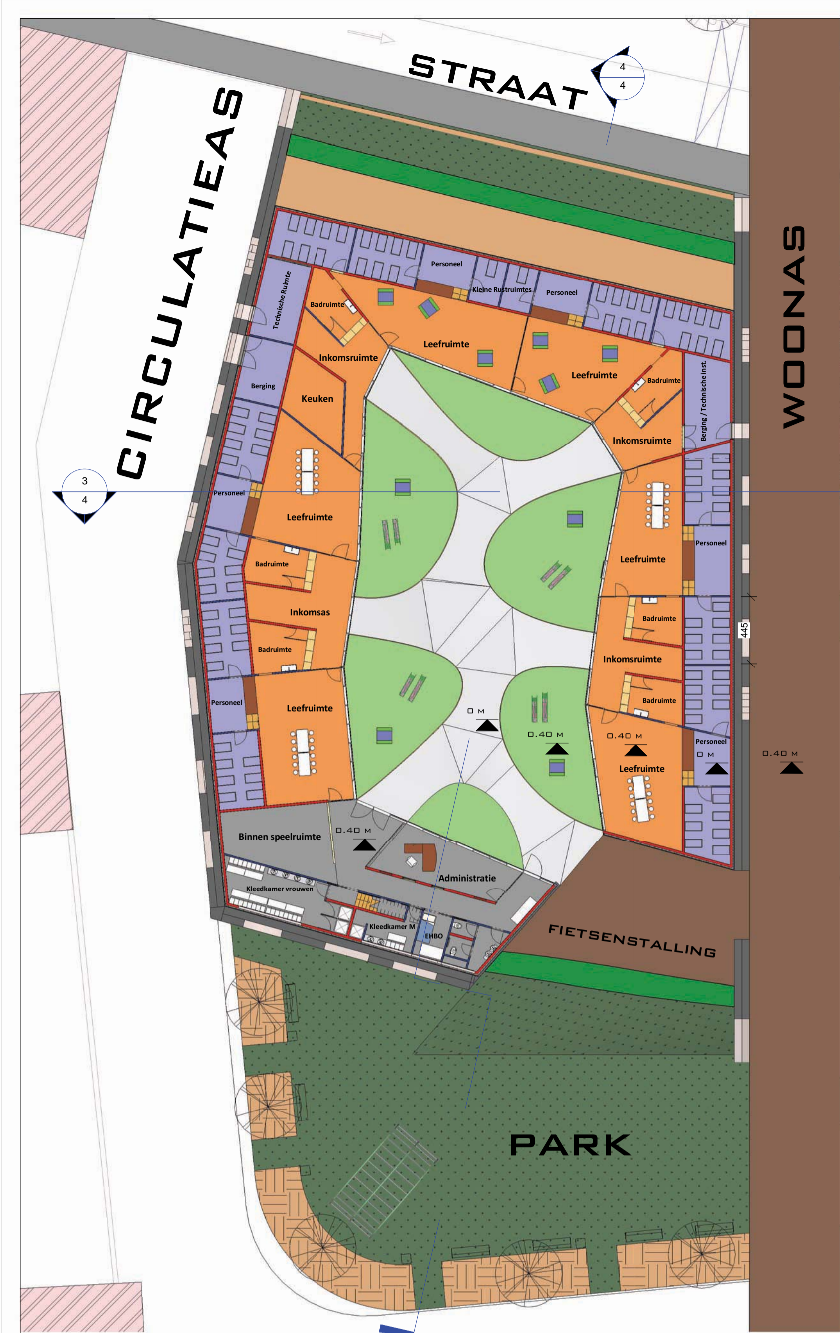
1 Gelijkvloers 1 : 250