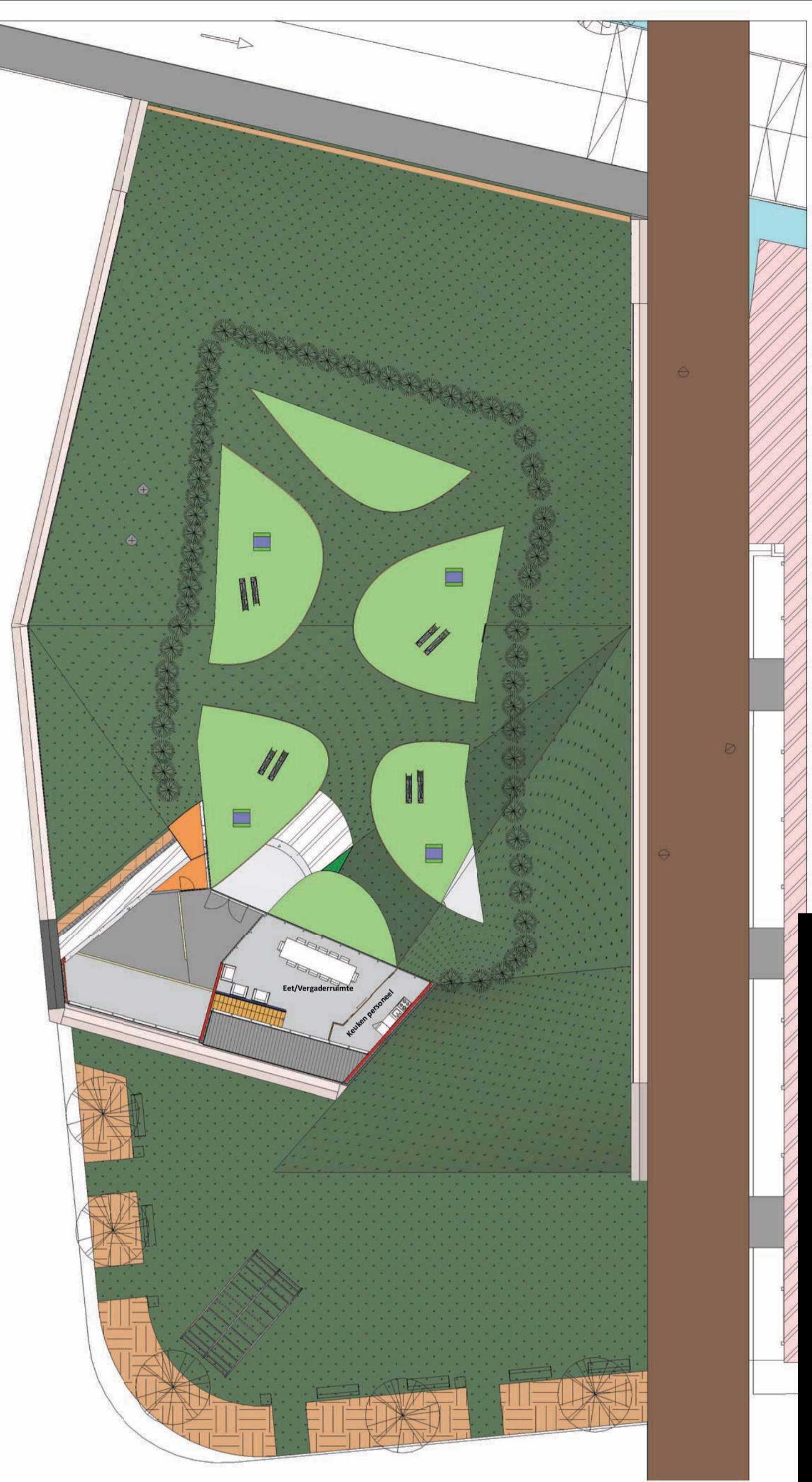
2 Verdieping/Dakplan 1 : 250