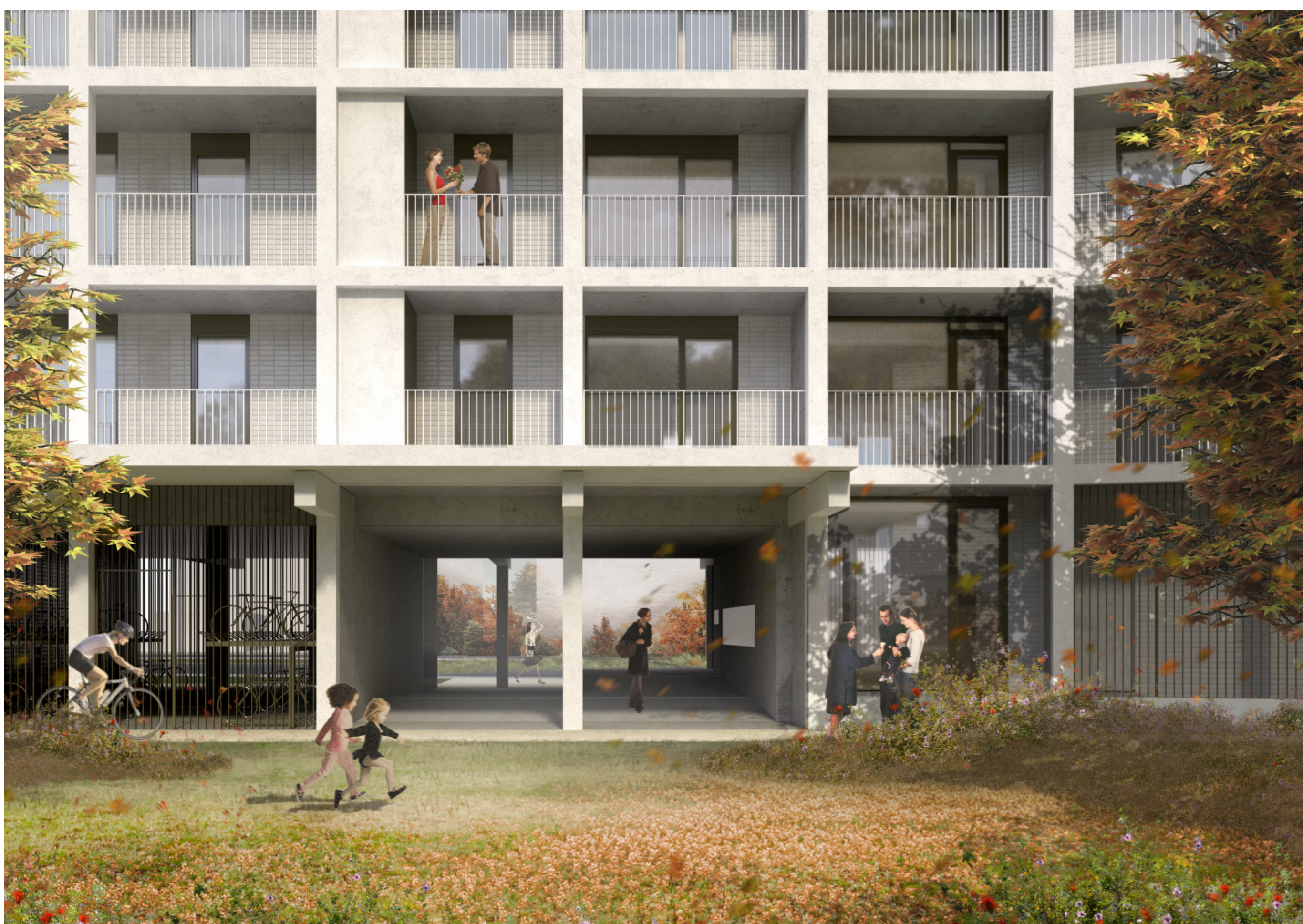
ONDERDOORGANG VANUIT HET PARK