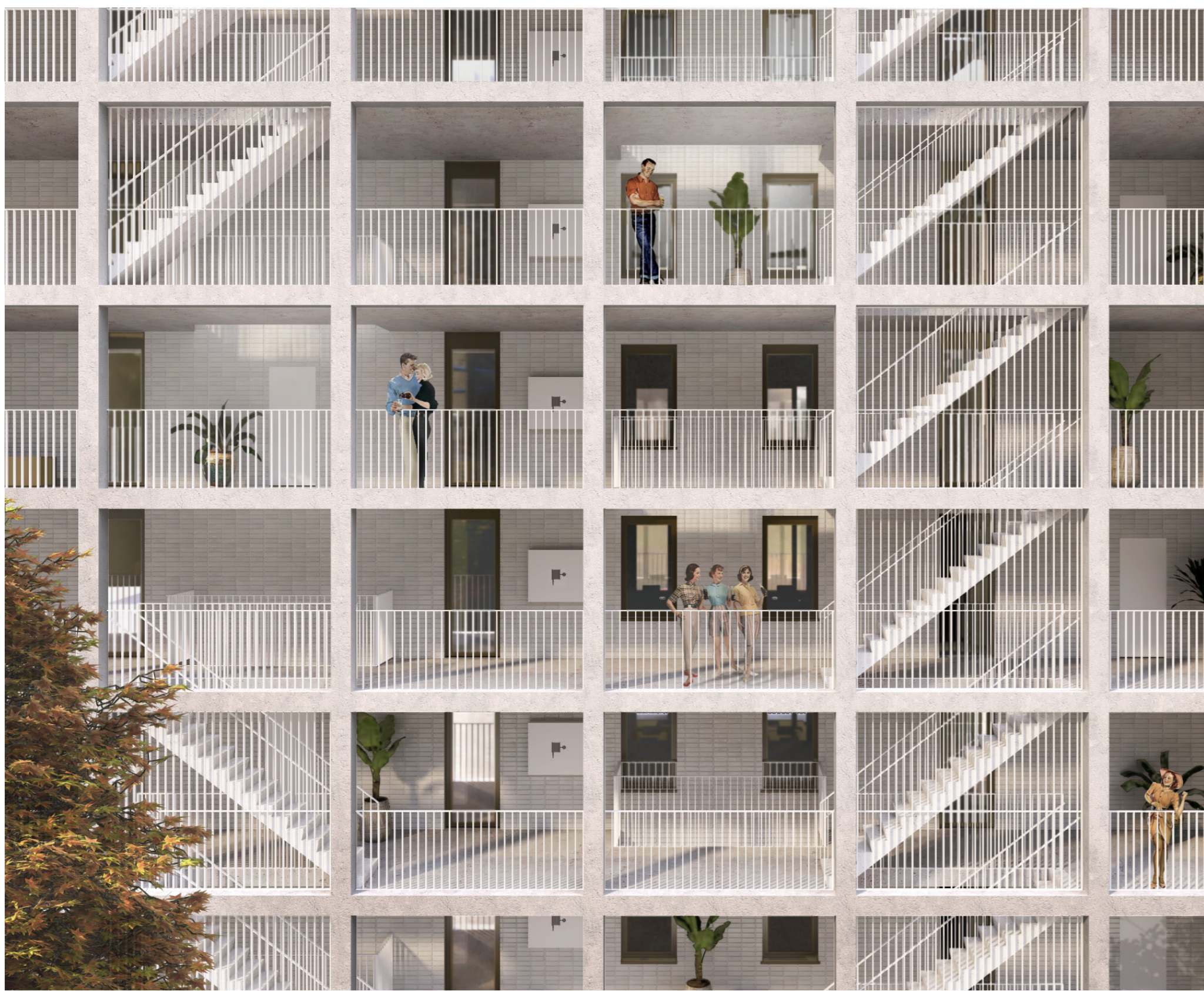
GAANDERIJ LANGS DE STRAATKANT