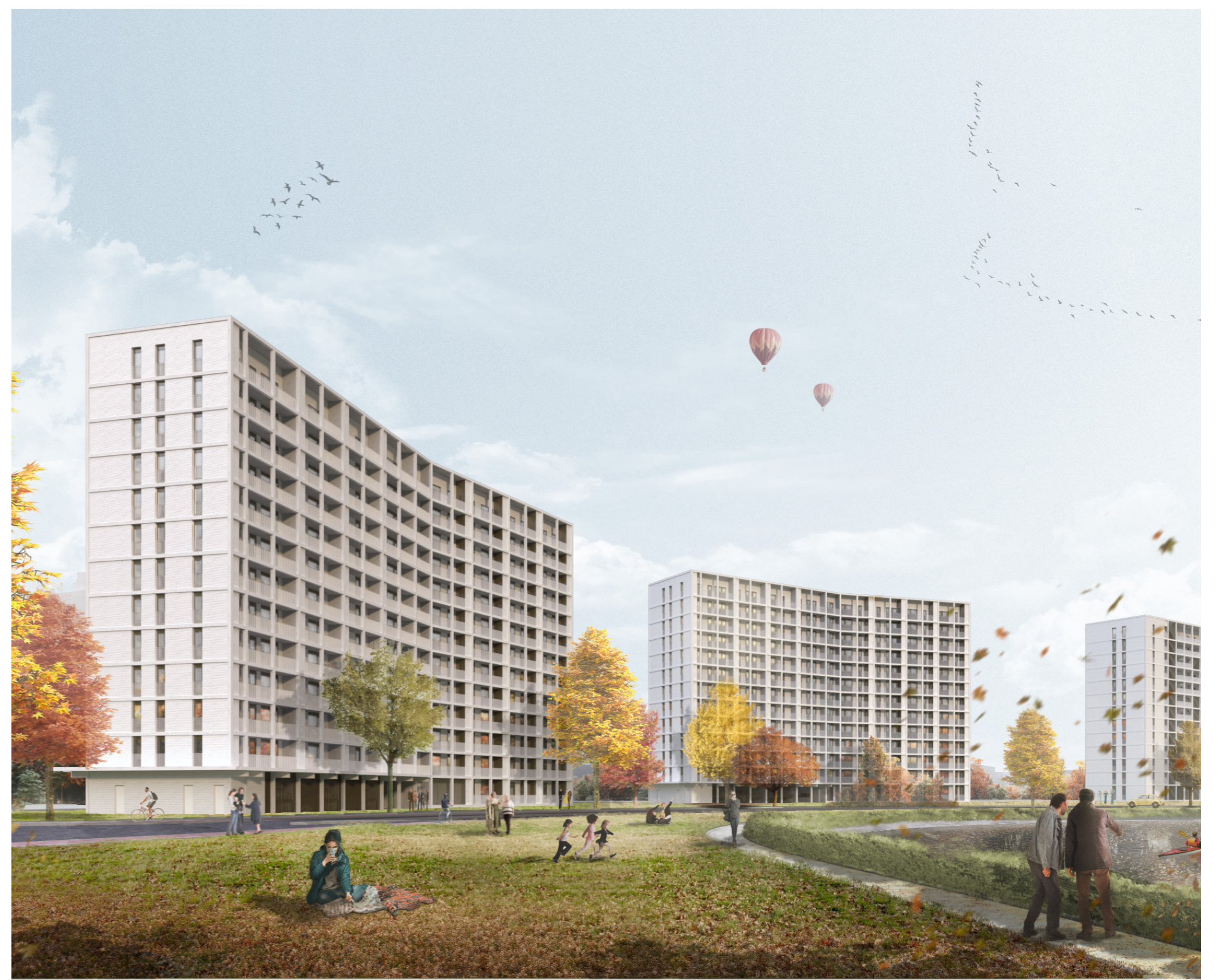
KOP VAN DE WATERSPORTBAAN